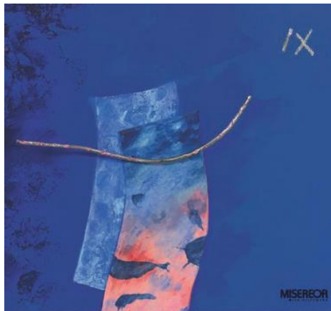
Ausschnitt aus dem Hungertuch

Die rot-blau bekleidete Gestalt rechts hat anmutig die Arme erhoben, die Balance haltend zwischen Hören und Handeln: Wofür stehe ich ein? Nehme ich die Botschaft Gottes und der Mit-Welt wahr und was erzählen sie mir? Die Potentiale der Menschen zusammenzuführen in dem „einen Haus“ – das ist das Projekt Gottes!