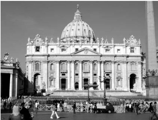
Vom 14. bis 19. September 2006 besuchte eine Gruppe von 23 Gemeindegliedern die heilige Stadt Rom.